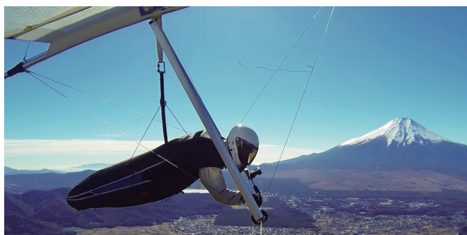
山梨県の杓子山周辺でハンググライダーでの飛行を楽しむ様子

量子コンピュータ等、多岐にわたるソフトウェア関連の知的財産関連の業務に携わってきましたが、「そろそろ、地元への恩返しを果たす頃になったのではないか」との思いが強まり、2025年3月に青空特許事務所を開設。空を縦横無尽に駆け巡るような自由な発想からなる研究開発をサポートすべく、事務所名にもその思いを込めました。