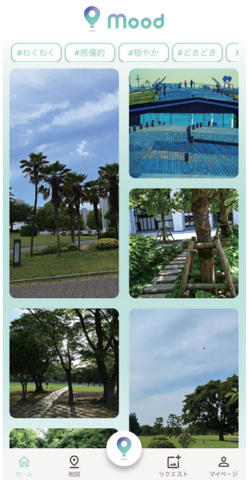
Mood画面から一部抜粋

ストレスケアという目に見えにくい課題だからこそ、ユーザーが自分に合った休み方を身につけ、自分の心が健康になるリズムに気づく世界を目指し、Safamii社は挑戦し続けます。