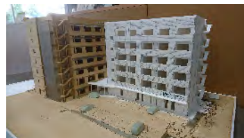
←SIC-2のロビーに展示している増築棟のモデル