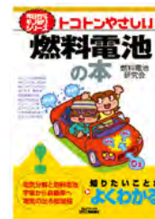
トップページがカラフルになった 日刊工業新聞