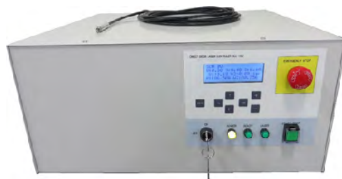
ダイオードダイレクトレーザー（DDL）

“ファブレスメーカー”として活動されています。現在は半導体関連の企業との取引が主ですが、これからは微細加工にニーズのある分野にも進出していきたいとのこと。これまでの受託開発という形態から自社製品の販売も展開することを目指し、青色LD（レーザー・ダイオード）による加工機の開発に取り組まれています。現状では赤色LDが主流ですが、吸収率や線幅といった青色LDの特性を生かした用途開発も睨みつつ、普及を早めるために低廉な価格での製品実現を目指しています。