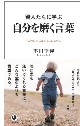
※2.「賢人たちに学ぶ 自分を磨く言葉」 本田季伸 著 かんき出版 2012/12

松下幸之助さんは、「素直な心とは、私心なくくもりのない心」「一つのことにとらわれずに、物事があるがままに見ようとする心」「そういう心からは、物事の実相を掴む力も生まれてくる」と表現されています。素直になって、事実を受け止めることです。