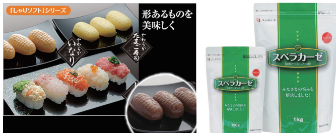
特許取得している「しゃりソフトシリーズ」と「スベラカーゼ」

持つ仕事であるかを謙虚に受け止め、「口から食事をとる」事で「自分らしく生きる」ことを介護・疾病などの分野で提案し続け、お客様の声を商品開発に繋げる為に日々努力をしている。