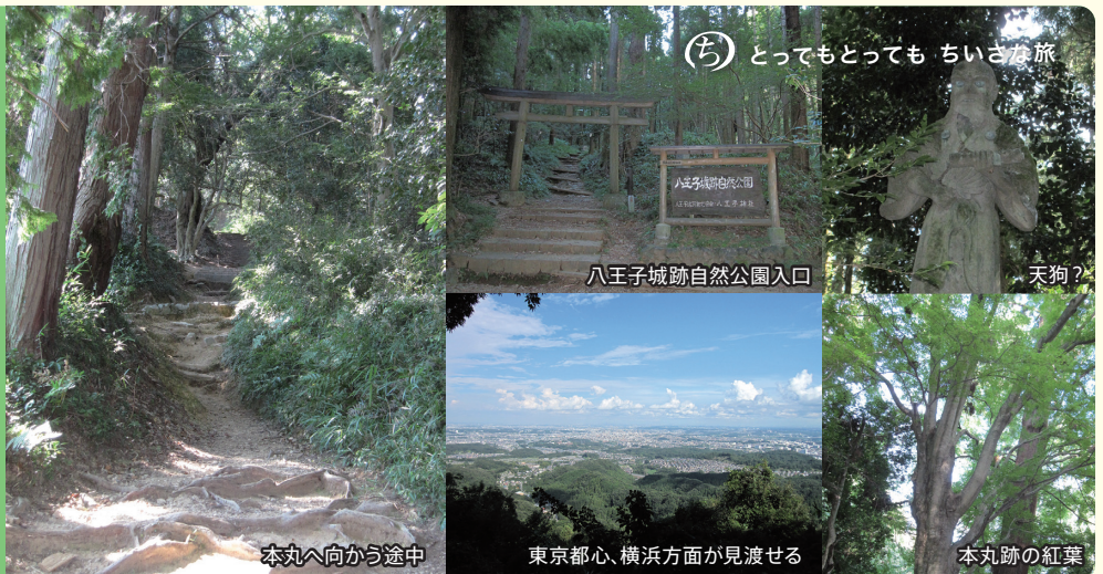
本丸へ向かう途中

津久井城址にもありましたが、八王子城址の本丸跡にも大きなもみじの木があります。移ろい行く歴史に似合うのかもかもしれません。