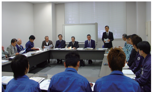
カイゼン自主研究会の様子