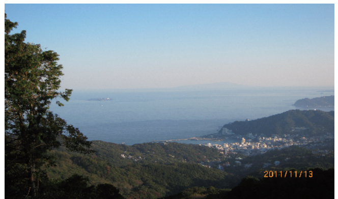
熱海のハイキングコースにて、友川さんが撮影した写真です。