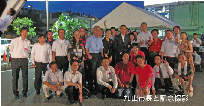
加山市長と記念撮影