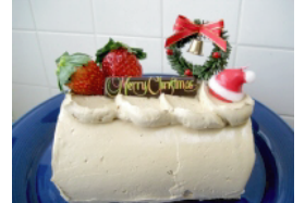
2人のモカロールセット ¥5,250.- (モカロール(19cm) & mini アレンジ)