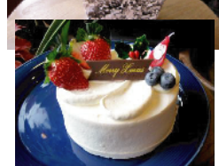
Special Christmas Set ¥5,500.- (Cake(直径12cm) & キャンドルアレンジ)