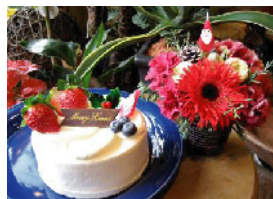
2人のChristmas Set ¥3,675.- (Cake(直径12cm) & mini アレンジ)

只今”2人のChristmas2010”ご予約受付中です。 最終受付：12月21日 お渡し日：12月23・24・25日 お申し込み：お電話(042-771-8733)または、 ホームページ http://www.bahati.jp から